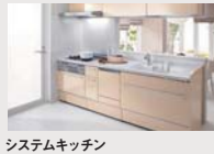
システムキッチン (コンロ・レンジフードなど)