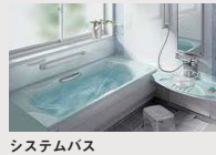
システムバス (浴室換気乾燥機など)