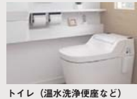
トイレ (温水洗浄便座など)